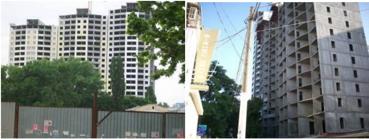
Будівництво житлового комплексу вул. Арміїській, 11 станом на 29.05.2009 р. та станом на 08.09.2009 р.