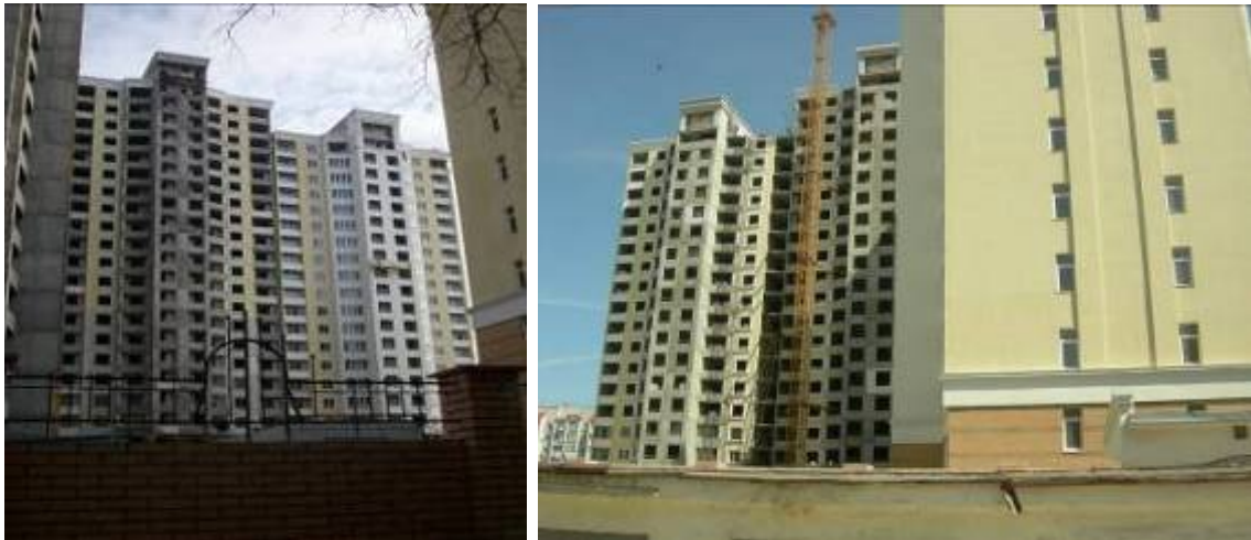
Будівництво житлового комплексу вул. Арміїській, 11 станом на 04.03.2010 р. та на кінець серпня 2010 р.