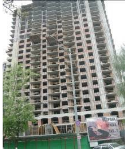
Хід будівництва житлового комплексу «Парк Авеню» (I черга) станом на 20.05.2009 р. (зліва-направо): будинок № 1 та будинок № 2