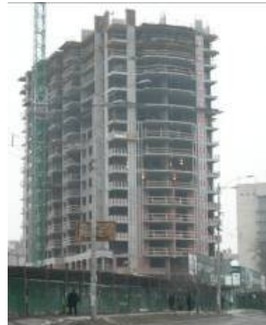
Хід будівництва житлового комплексу «Парк Авеню» (I черга) станом на 26.02.2009 р. (зліва-направо): будинок № 1 та будинок № 2