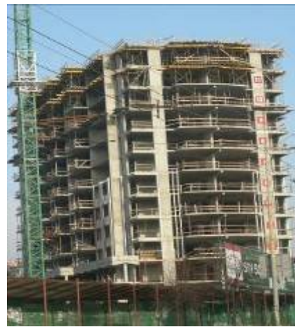
Хід будівництва житлового комплексу «Парк Авеню» (I черга) станом на 10.12.2008 р. (зліва-направо): будинок № 1 та будинок № 2