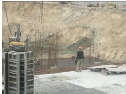
Хід будівництва житлового комплексу «Парк Авеню» (II- IX черги) станом на 20.05.2009 р.